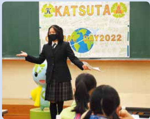
グローバルデイで話をする留学生