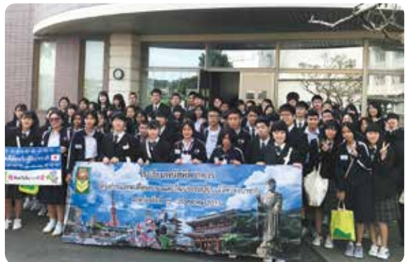
海外学生の訪問受け入れ（タイ王国ファナトピタヤカン学校）